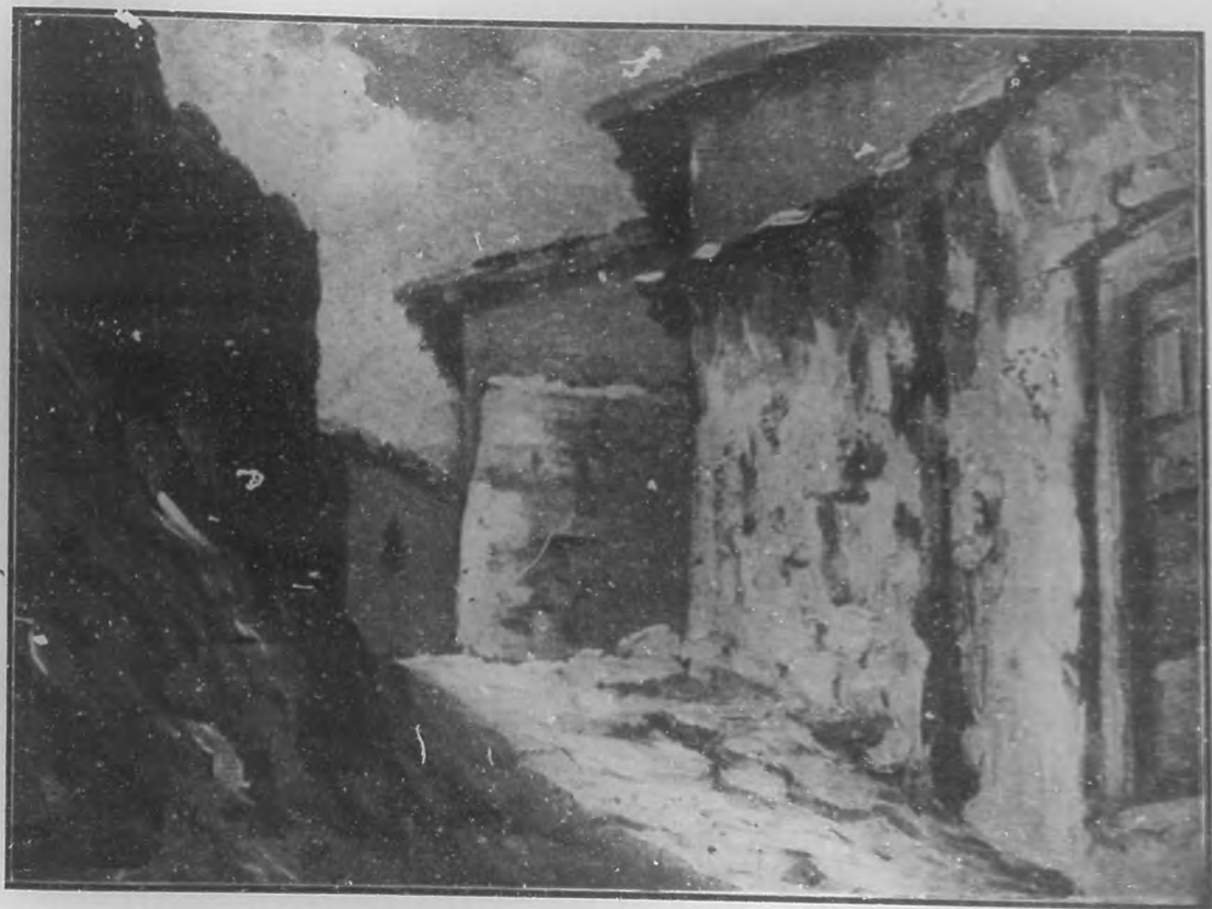
CALLE SOLITARIA Oleo de Castor González Darna.