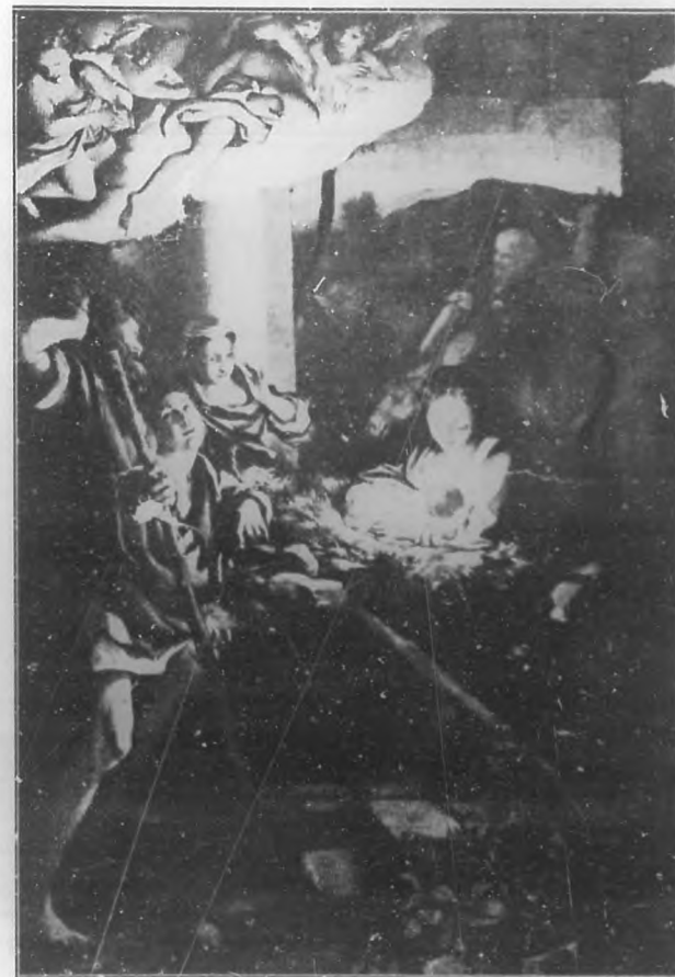
LA NOCHEBUENA Célebre cuadro de "El Correggio" (Antonio Allegri).

El que esto escribe, ha pasado varias Navidades en un campo con la nieve, y lleva algunas en Cuba; pero he de afirmar que, cuando se la presenta el espíritu en alguna meditación, se puede estar alegre en esta memorable fecha—la más grande de cuanto registra la Historia—bajo nuestro cielo tropical, que festeja la vida a la vera del hogar mientras sopla el viento huracanado, golpeando en los cristales con los copos de nieve que lleva en sus alas.