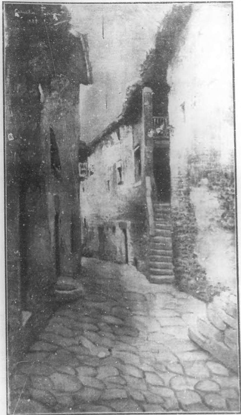
CALLEJUELA Oleo por Concha Ferrant B. S.