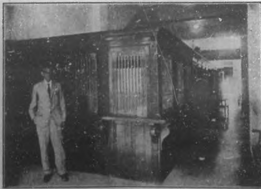
Departamento de Caja de la Compañía Realizadora de Créditos Bancarios en su local social calle de O'Reilly Núm. 114.

Nuestra intención es ayudarles ayudándonos y nuestro programa leal y patriótico, merece la cooperación de todos.